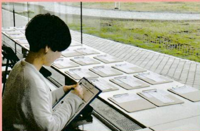
応募用紙にタイトルを記入