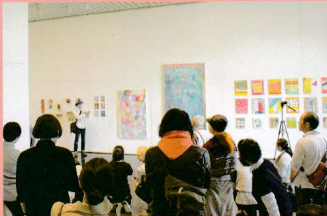
作家が選んだタイトルの発表会 メイメイアート vol.2 (2017.5.7)